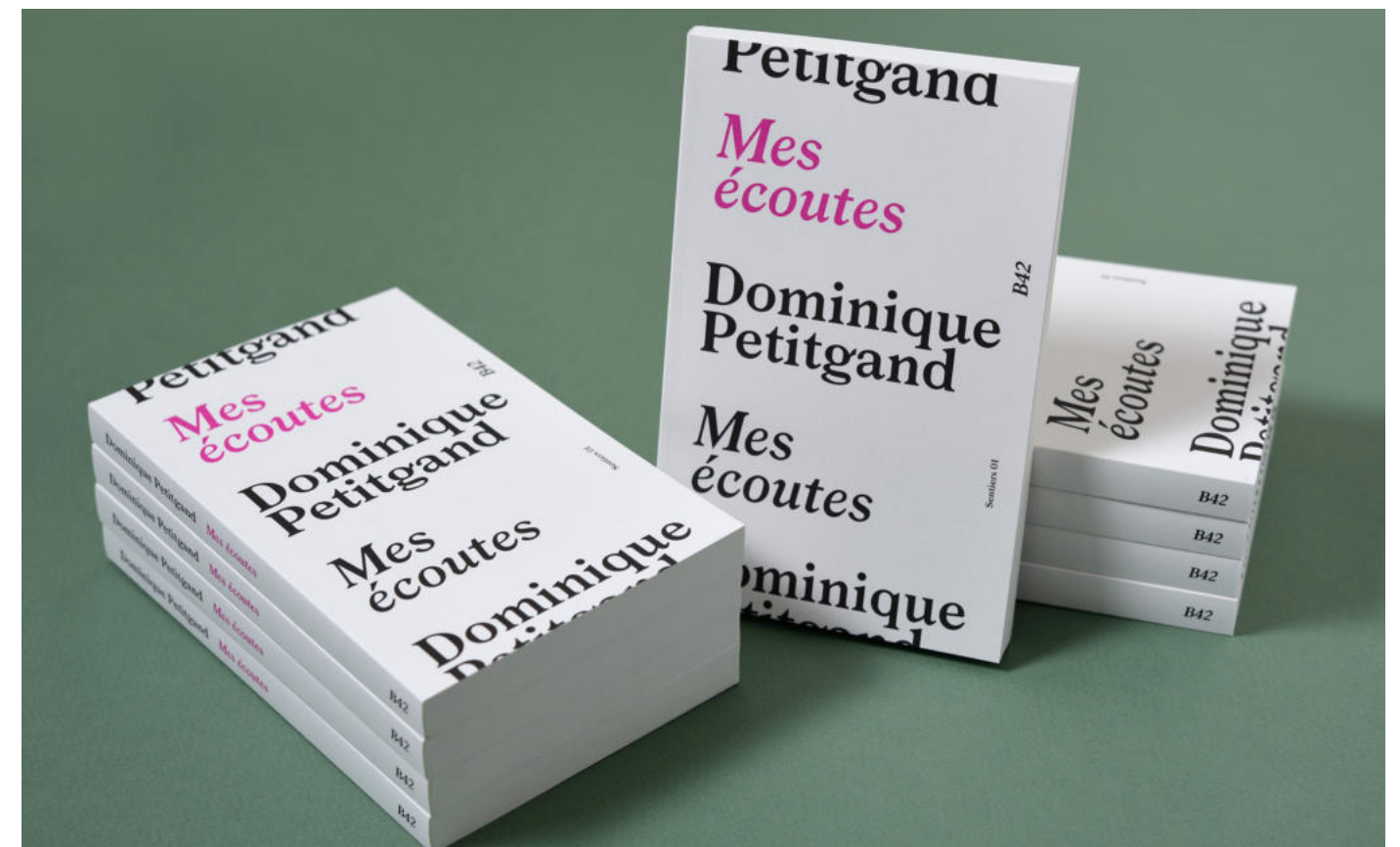
Dominique Petitgand, Mes écoutes , livre, édition B42, 2022.