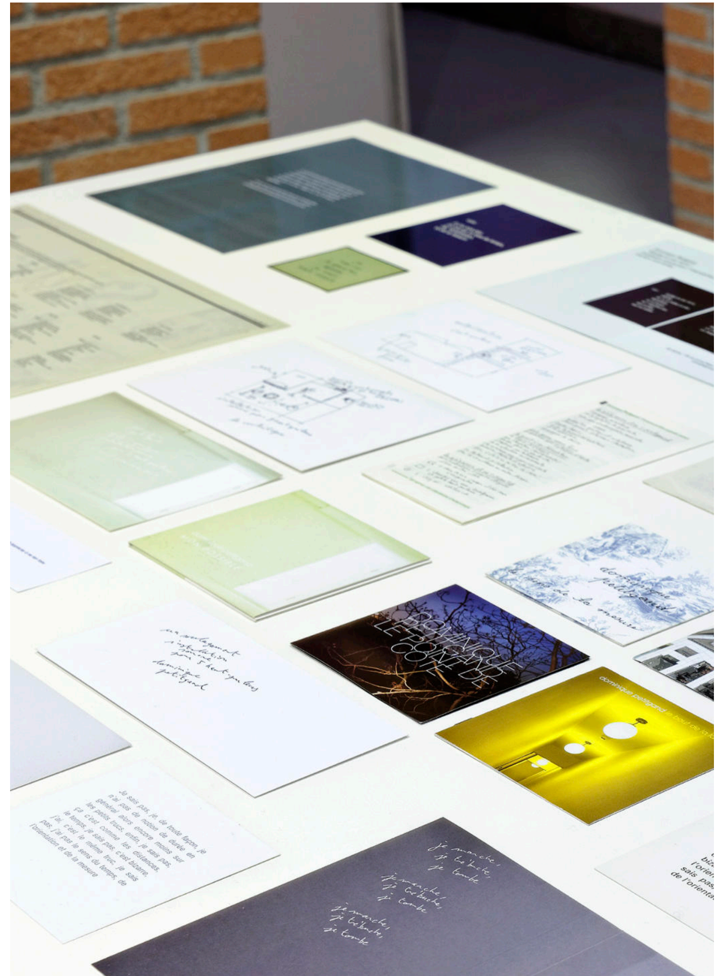
Dominique Petitgand, Ephemera , CIAP Vassivière, 2015 (vue partielle) - photo Aurélien Mole.

Depuis quelques années, il a introduit dans ses œuvres des principes de transcription, de traduction ou d'écritures périphériques qui, par le biais d'une articulation entre son et texte, et d'une bascule entre l'écoute et la lecture, produisent de nouvelles mises à distance et effets d'échos au sein de la narration.