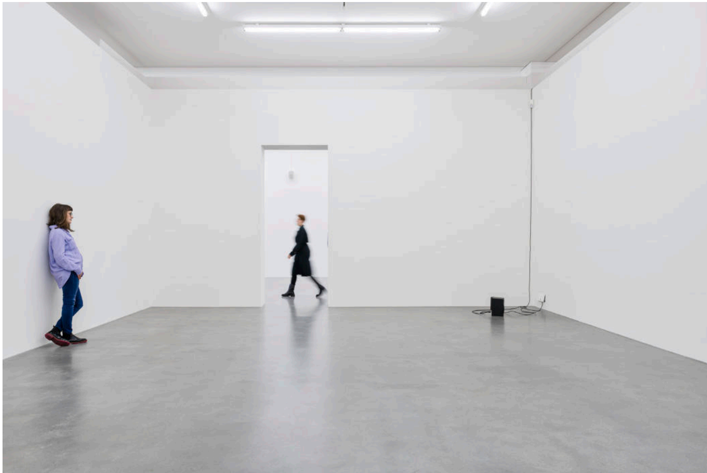
Dominique Petitgand, Le poumon et les nerfs , PEAC Museum, Fribourg-en-Brisgau, 2023 (vue partielle)

Je ne parlerais pas de « sculpture sonore », préférant le terme d'« installation sonore » s'agissant de dispositifs de diffusion des sons pour lesquels le lieu, le milieu, l'alentour sont pris en compte et interagissent avec l'œuvre elle-même. Donc, une approche qui n'est pas centrée vers un objet (autour duquel l'on tournerait), mais, au contraire, à partir d'un ou de plusieurs éléments tournés vers ce qui se passe autour. »