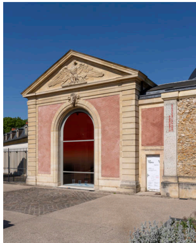
Vue du centre d'art depuis la Place des Manèges.

La Maréchalerie est membre du réseau TRAM qui organise les TAXI et RANDO TRAM, visites d'exposition et rencontres en présence des artistes invités et les équipes des structures.